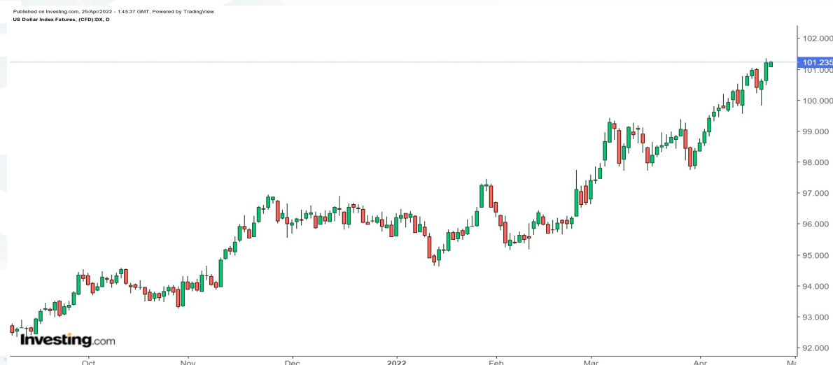
График 3 : DXY /ам.долларын индекс/-ийн 7 хоногийн лаа

Мэдэгдэл: Энэхүү судалгаанд дурьдагдсан аливаа таамаглал нь зөвхөн мэдээллийн зорилготой бөгөөд аливаа хөрөнгө оруулалт, арилжаа хийхийг ятгасан, санал болгосон үйлдэл биш болно. Энэхүү судалгаанд дурьдагдсан таамаглалаас үүдэн гарах аливаа эрсдэлийг шинжээчи болон компани хариуцахгүй болно. Энэхүү тойм, судалгаа, таамаглалыг зөвхөн өөртөө зориулан ашиглаж, бусдад түгээн олшруулахыг хатуу хориглоно.