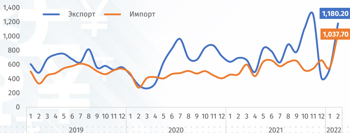
График 2: Гадаад худалдаа (сая ам.доллар)

Мэдэгдэл: Энэхүү судалгаанд дурьдагдсан аливаа таамаглал нь зөвхөн мэдээллийн зорилготой бөгөөд аливаа хөрөнгө оруулалт, арилжаа хийхийг ятгасан, санал болгосон үйлдэл биш болно. Энэхүү судалгаанд дурьдагдсан таамаглалаас үүдэн гарах аливаа эрсдэлийг шинжээчи болон компани хариуцахгүй болно. Энэхүү тойм, судалгаа, таамаглалыг зөвхөн өөртөө зориулан ашиглаж, бусдад түгээн олшруулахыг хатуу хориглоно.