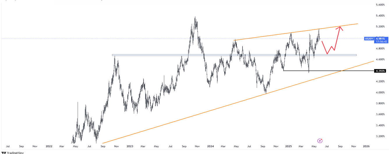
График 2. АНУ-ын 20 жилийн хугацаатай ЗГ-ын бондын өгөөж

Уг хямралыг Moody's агентлаг АНУ-ын зээлийн үнэлгээг бууруулсантай холбон тайлбарлаж байна. Moody's энэ алхмыг АНУ-ын төсвийн алдагдал нэмэгдэж, улсын өр өсөж буйд санаа зовнин хийсэн гэж тайлбарласан.