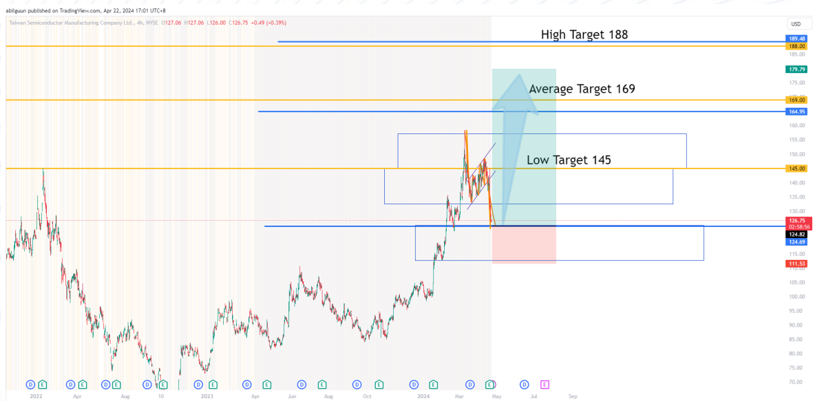
График 2: TSMC хувьцааны ханшийн график ба техник шинжилгээ

Taiwan Semiconductor Manufacturing Company нь хөрөнгө оруулахад дараах 2 давуу талтай байна: