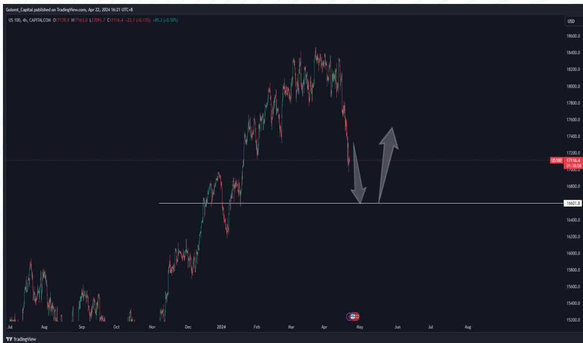
График 1: NASDAQ100 индекс

4 сарын 12-ноос хүчтэй уналтын чиг хандлагын эрч саараагүй байна. Энэ сард технологийн аваргууд тайлангаа танилцуулах тул зах зээл хөндлөн чиглэлийн хөдөлгөөн ажиглагдах боломжтой.