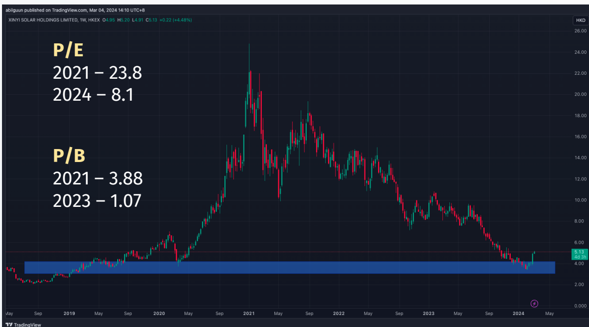
График 2: Xinyi Solar компанийн хувьцааны ханш

Өнгөрсөн мягмар гарагт компанийн 2023 оны цэвэр ашиг 9.6 хувь өсөж HKD 4.19 тэрбум буюу USD 535.2 сая хүрсэн байна. Deutsche Bank болон Jefferies санхүүгийн байгууллагууд тус үзүүлэлтүүд нь цэвэр ашгийн хүлээлтийг давсан гэдгийг мэдэгджээ.