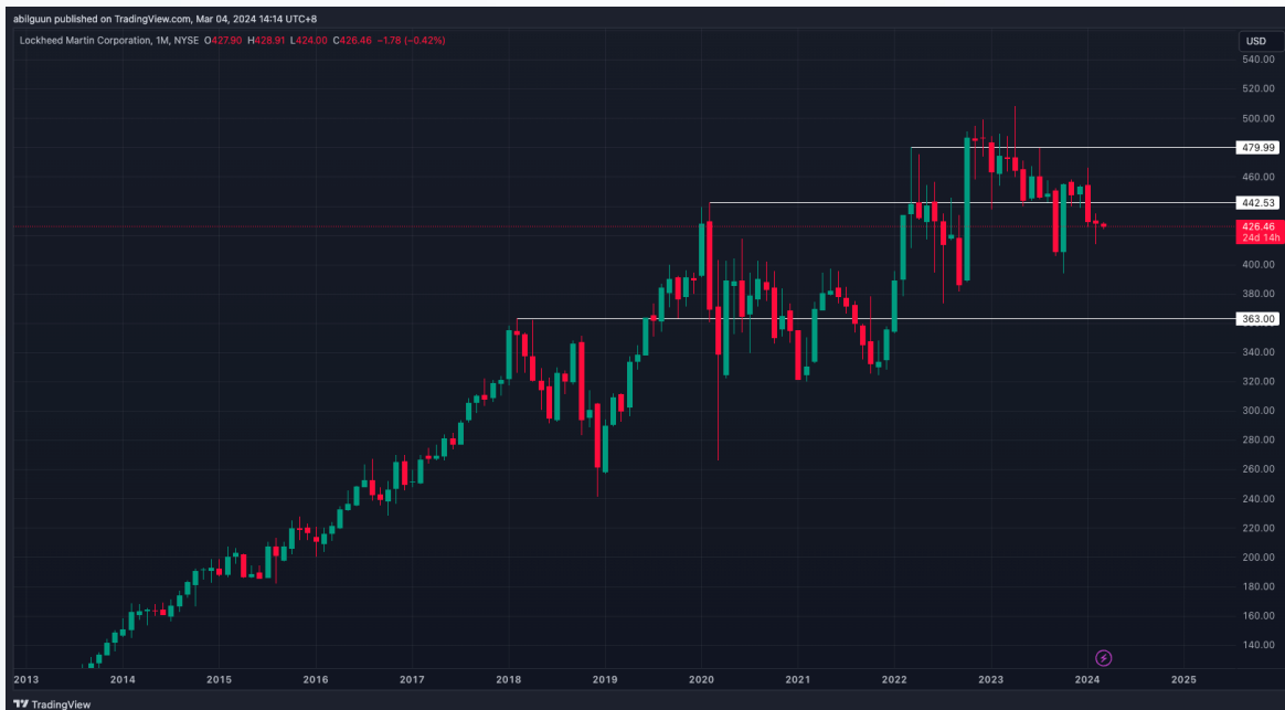
График 1: Lockheed Martin Corporation компанийн хувьцааны ханш /сараар/

АНУ 2024 оны батлан хамгаалахын зардалаа 842 тэрбум ам.долларт хүргэж, өмнөх төсөөллөөс 5% өсгөөд байгаа ба геополитикийн эрсдэлийн түвшин нэмэгдэж байгаа нь батлан хамгаалах, агаарын цэргийн технологийн компанийн хувьцааны ханшид зэрэгээр нөлөөлж болзошгүй.