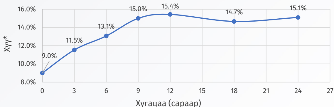
График 3 : Биржийн бус зах зээлийн өгөөжийн муруй