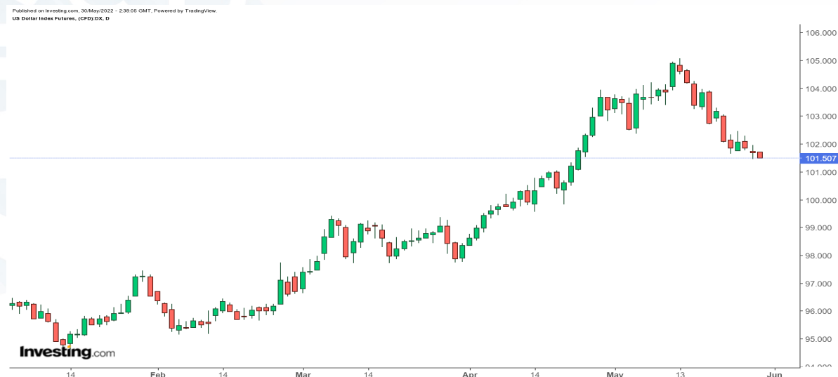
График 3 : DXY /ам.долларын индекс/-ийн 7 хоногийн лаа

Мэдэгдэл: Энэхүү судалгаанд дурьдагдсан аливаа таамаглал нь зөвхөн мэдээллийн зорилготой бөгөөд аливаа хөрөнгө оруулалт, арилжаа хийхийг ятгасан, санал болгосон үйлдэл биш болно. Энэхүү судалгаанд дурьдагдсан таамаглалаас үүдэн гарах аливаа эрсдэлийг шинжээчи болон компани хариуцахгүй болно. Энэхүү тойм, судалгаа, таамаглалыг зөвхөн өөртөө зориулан ашиглаж, бусдад түгээн олшруулахыг хатуу хориглоно.