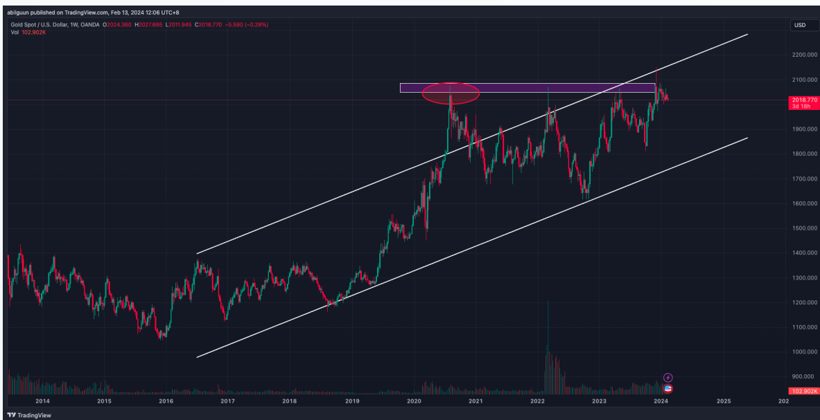
График 2: Алтны ханш

Ирж буй Луу жилд алтны үнэ 30 гаруй хувь өсөх хандлагатай байгаа нь алт болон алтан эдлэлийн борлуулалт өсөж буйтай холбоотой. Азийн орнуудад Луу жил гэр бүл зохиож хүүхэд төрүүлэх нь тохиромжтой гэж үздэг бөгөөд өнгөрсөн Луу жил болох 2012 онд Hang Seng индекс 22.9 хувь өсөж байсан түүхтэй байна. Харин 2024 онд шинжээчдийн таамаглалаа Азийн голлогч индекс 12-р сар гэхэд 20,000 хүрэх бүрэн боломжтой бөгөөд эдийн засгийн өсөлттэй жил байх тохиолдолд 25,000 хүрэхийг үгүйсгэж болохгүй.